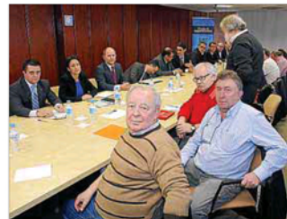
Reunión entre patronal y sindicatos de hostelería.

tual. Lo que importa es que el Govern controle la letra pequeña y no tengamos luego sorpresas por no analizar como se debe una cuestión tan vital como ésta, que afecta al futuro de la gestión de los aeropuertos de Balears, nuestra puerta de entrada millones de turistas.