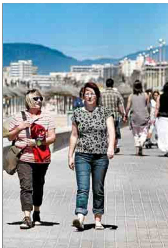
Turistas ayer paseando en Playa de Palma.

En esta Pascua, la zona norte de Mallorca ha sido la que ha registrado la ocupación más alta, con porcentajes de hasta el 85% en Pollença, Alcúdia o Muro. «Además, ha tenido mucha importancia el turismo mallorquín, sobre todo en Cala Millor y Cala D'Or», destaca la gerente. En el caso de los agroturismos, se ha al-