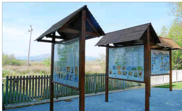
El Club Pollentia Resort ha instalado paneles casi idénticos a los que hay en el centro de interpretación de la flora y fauna en la Gola.

El conseller recordó las dificultades económicas que arrastra su