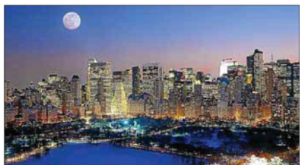
Vista de Manhattan, donde Meliá tendrá un hotel en 2016.