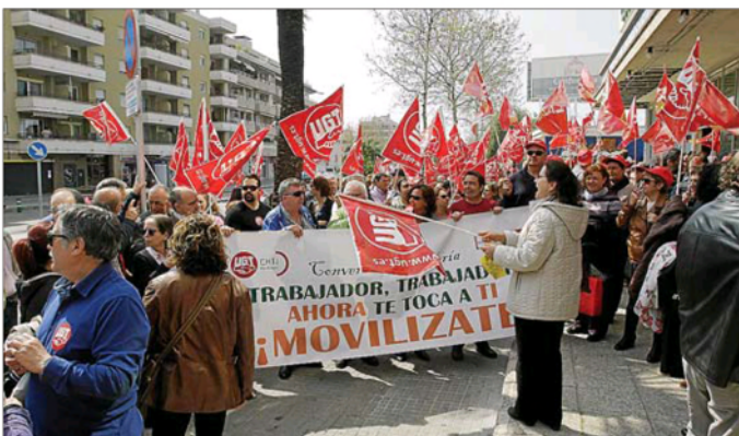
Unos 200 delegados sindicales de CCOO y UGT se concentraron ayer frente a la CAEB.

Hasta diez grupos, entre los que hay Iberia y Globalia se han presentado al concurso público convocado por AENA para la concesión de licencias de asistencia en tierra (handling) en 22 aeropuertos. Son Sant Joan se licitará en una segunda fase.