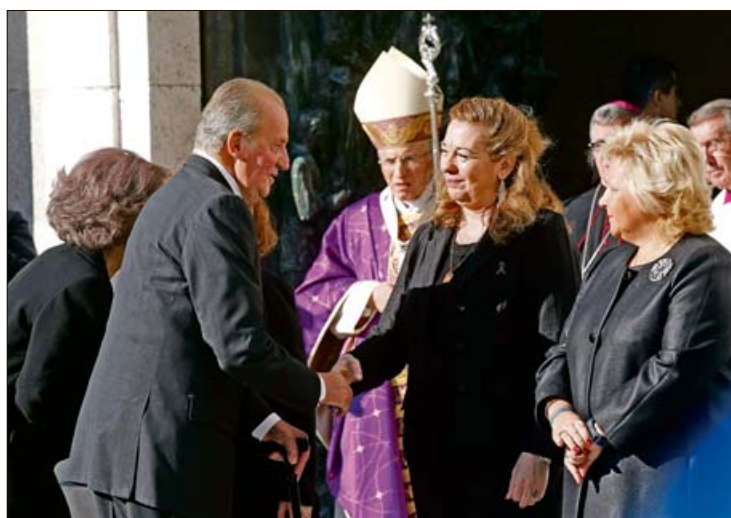
Los Reyes saludan a las asociaciones de víctimas.

■ El aniversario de los atentados en los trenes de Madrid logró unir a las asociaciones de víctimas, algo que no había ocurrido en los años anteriores. Los Reyes presidieron el funeral en el que el cardenal Rouco denunció a los que "mataron inocentes por oscuros objetivos de poder". P 28