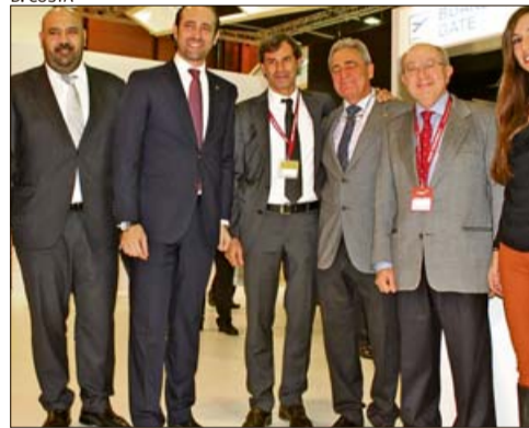
Bauzá y el conseller con hoteleros de Calviá.