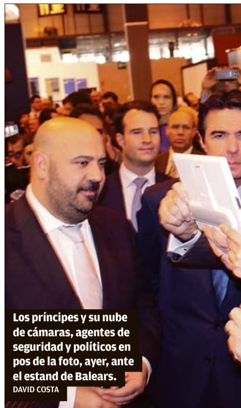
Los príncipes y su nube de cámaras, agentes de seguridad y políticos en pos de la foto, ayer, ante el stand de Balears.