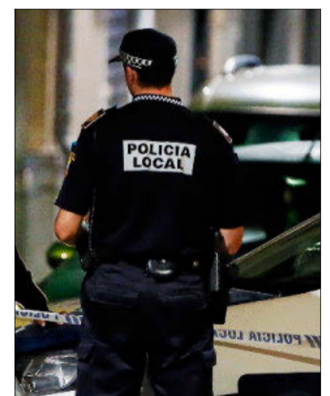
Imagen de un agente.

El consistorio incide en que los policías de paisano se centrarán en perseguir el abandono de trastos en la calle, los vertidos ilegales