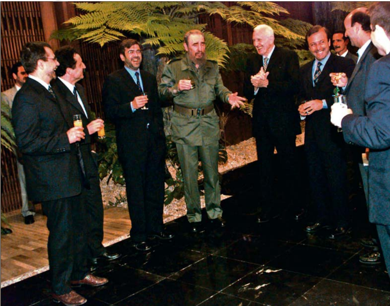
Francesc Antich, sonriente durante su audiencia de seis horas con Fidel Castro en La Habana.

ADÍOS A UNA FIGURA HISTÓRICA ▶ TESTIMONIOS DE MALLORQUINES QUE CONOCEN BIEN LA CUBA DE FIDEL