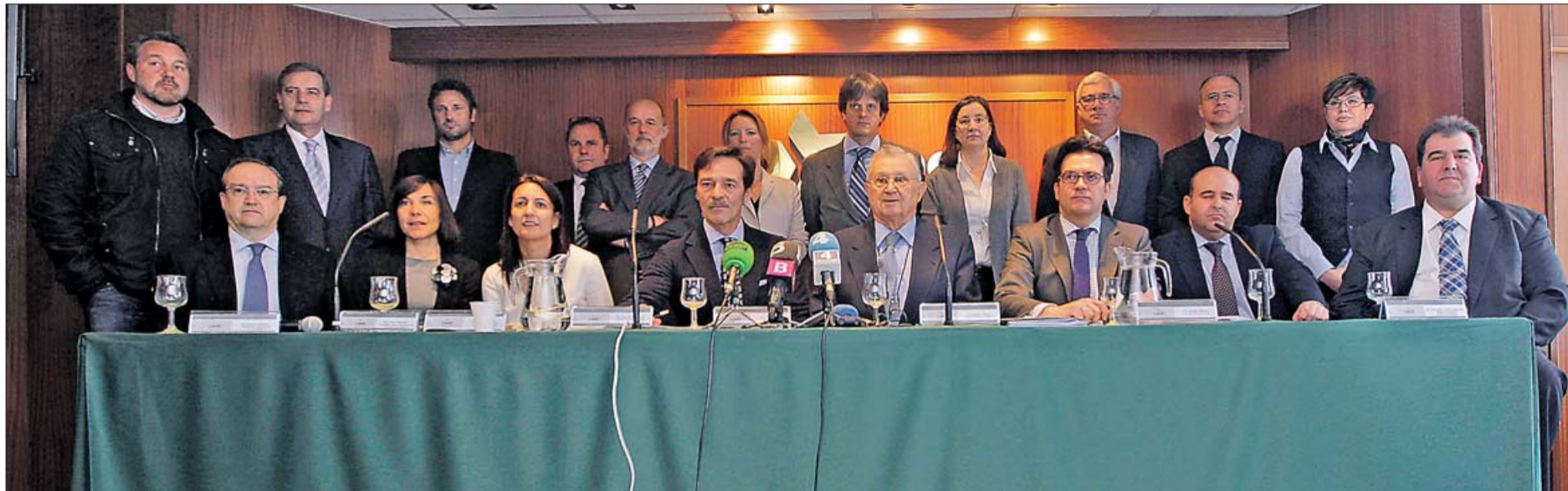
Los sectores afectados por el impuesto que el Govern quiere aplicar sobre los envases mostraron su rechazo a la medida en la sede de la CAEB. M. MIERNIEZUK

OPOSICIÓN A LOS NUEVOS IMPUESTOS DEL GOVERN ► LAS EMPRESAS AFECTADAS SE UNEN EN CONTRA DEL TRIBUTO SOBRE ENVASES