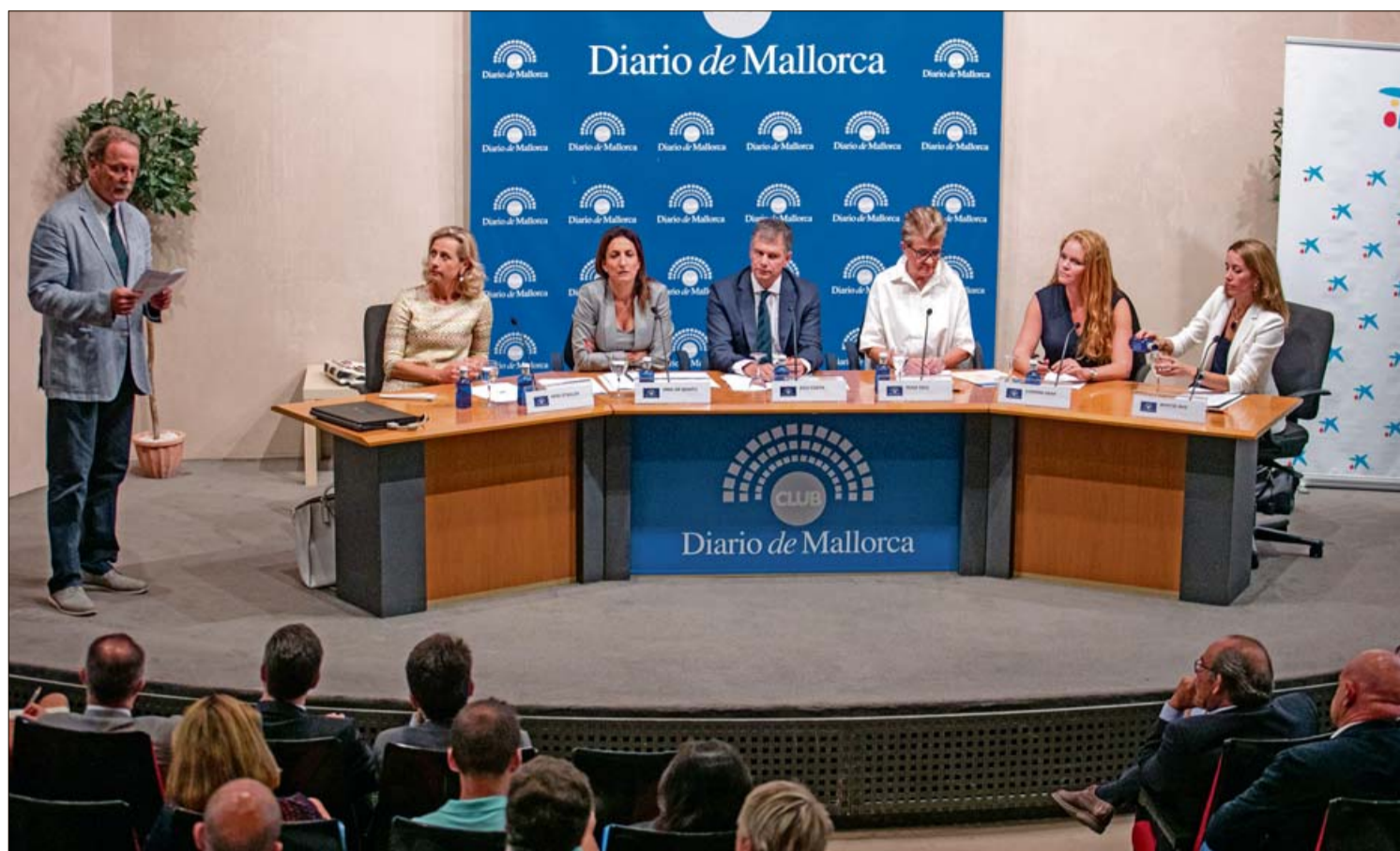
El nuevo curso del Club Diario de Mallorca se inauguró con una mesa redonda dedicada a la presencia femenina en la economía. G. BOSCH