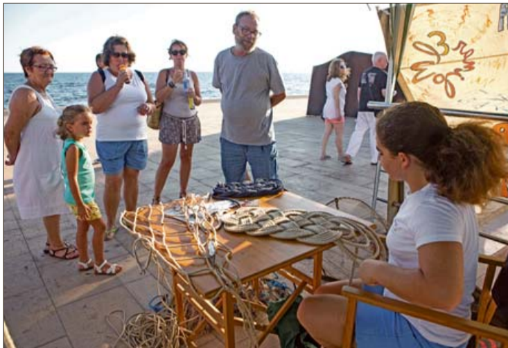
Una de las paradas de la feria marinera de 2015. GUILLEM BOSCH

Otro de los alicientes será la tómbola y la venta de pa amb oli , que servirán para financiar la feria. "Hemos querido recuperar las variedades tradicionales. En las primeras ferias nadie los pedía y ahora los de bacalao y arenque son