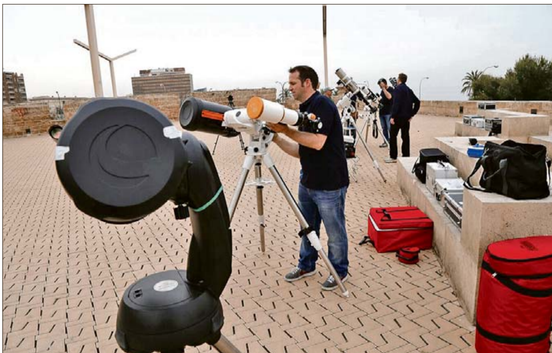
Los astrónomos se reunieron en el Baluard del Príncipe con sofisticados telescopios.

El contrato prorrogado por el tripartito data de 2012. También fue elaborado por los populares, pero no incluía los recortes planteados por el PP en 2014. La regiduría de Bienestar Social está trabajando en unos nuevos pliegos para sacar de nuevo a concurso el servicio de acogida municipal.