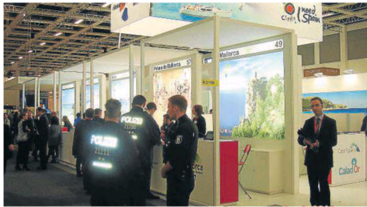
La Policia alemanya vigilà durant el matí de dimecres l'estand de les Illes Balears a la ITB.