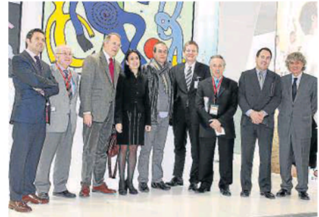
Representants del sector turístic, ahir a l'estand de Balears a la ITB.