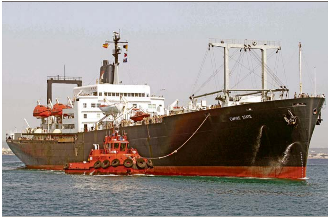
El Empire State es el principal navío de la Facultad Marítima de la State University of New York. M. R. AGUILERA

La Federación de Empresarios de Comercio de Baleares (Afedeco) asegura que se han producido "graves irregularidades" en la construcción del nuevo centro comercial del Coll d'en Rabassa. Según la entidad, Carrefour no ha cedido a la administración municipal el 10% del suelo que exige la ley. Acusan, a su vez, al Ayuntamiento de favorecer a la multinacional en el proceso de ejecución. REDACCIÓN PALMA