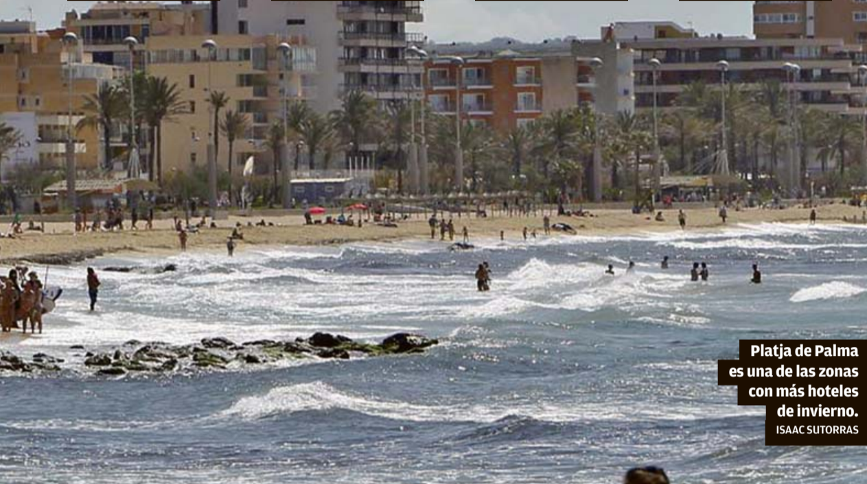
Platja de Palma es una de las zonas con más hoteles de invierno. ISAAC SUTORRAS