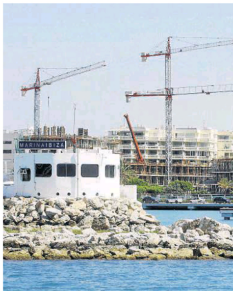
Els promotors diuen que a Eivissa ja s'ha acabat l'habitatge nou.

dants puguin pagar. "No hem de tornar a caure en les errades del passat", digué.