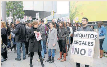
Els treballadors del Parc Bit tornaren a concentrar-se ahir.

Encara no se sap el nombre de treballadors que es podran salvar, ja que Orizonia encara està negociant les parts del negoci que vendrà. • M.R.