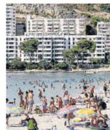
Balears tindrà un bon estiu.

Respecte del finançament, els promotors confien que les entitats començaran a obrir l'aixeta del crèdit a partir del segon semestre de l'any. Això sí, amb condicions diferents de les que provocaren el crac: sol pagat pel promotor i projectes viables en els quals existeixi una demanda real.