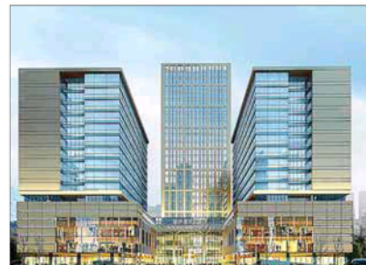
Fachada virtual de los hoteles Meliá Zhengzhou e Inside.

El complejo hotelero estará compuesto por tres edificios, uno estará ocupado por el hotel 'Inside', mientras que los otros dos