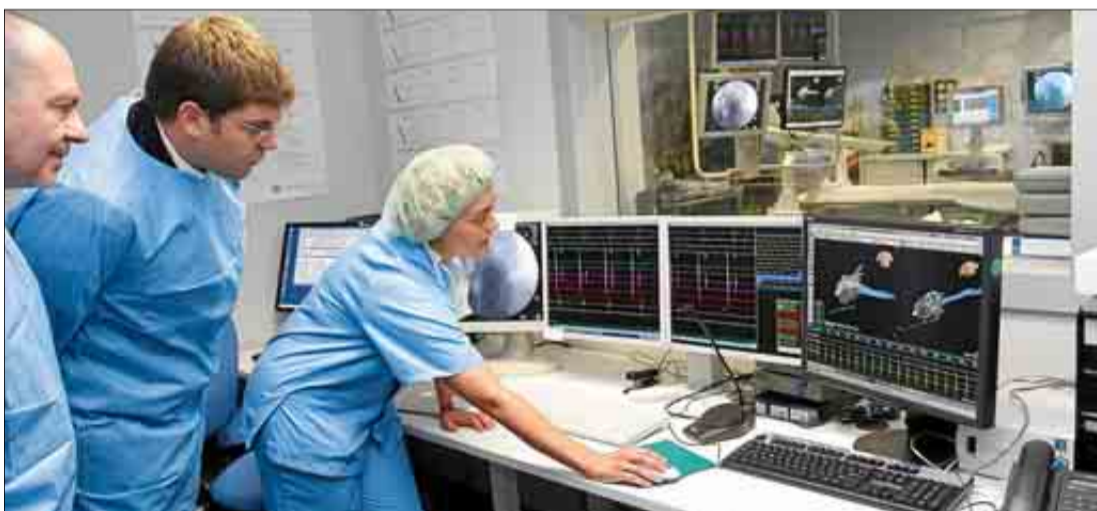
El conseller de Salut, Martí Sansaloni, ayer conociendo la nueva técnica de Son Espases.

La aerolínea explicará también la oferta turística invernal de la isla mediante su revista electrónica, que de acuerdo a la compañía, la reciben un millón de personas y costaría unos 20.000 euros, y además a través de las redes sociales Facebook y Twitter con su marca, que en conjunto tienen casi 50.000 usuarios.