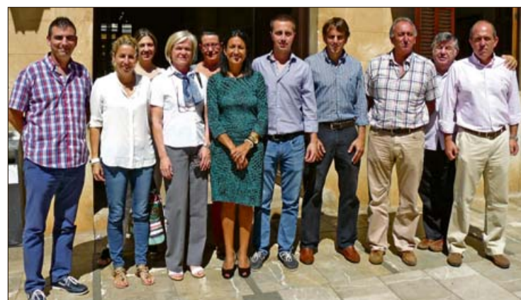
Autoridades políticas y representantes turísticos. AJUNTAMENT DE SANTANYÍ

En este sentido, el consistorio se muestra tremendamente feliz por