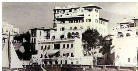
Imagen de la fachada del establecimiento en el año 1953.

La modernización de sus instalaciones en los dos últimos años ha configurado un establecimiento urbano muy competitivo en el Passeig Marítim