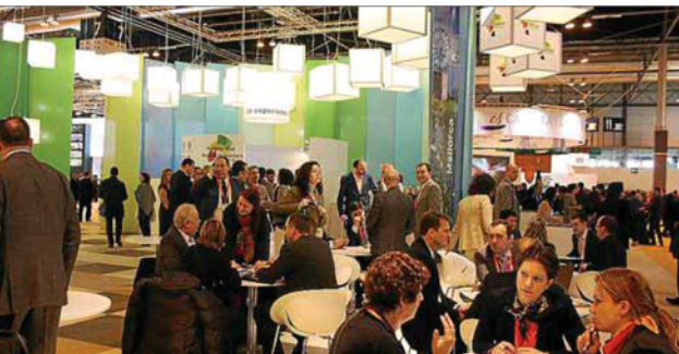
Ambiente en el stand de Balears. A la derecha, Bauzá con la ministra en el pabellón de las Islas.

La ministra de Fomento, Ana Pastor, hizo ayer política de Gobierno al apoyar de forma tácita ante toda la prensa española presente en Fitur la reivindicación del presidente José Ramón Bauzá. Las discrepancias y mensajes contradictorios habidos en los últimos días sobre los descuentos del 50 % obligó a la ministra a tomar cartas en el asunto y desplazarse a la feria madrileña para zanjar de raíz esta cuestión. El 'paseillo' que obligó a recorrer al presidente Bauzá por el stand de Renfe, donde vio todas las inversiones del AVE, así como la red ferroviaria estatal, quizás fue excesivo, pero en ningún momento dejó solo a Bauzá, quien recibió así un respaldo manifiesto del Gobierno central. En contrapartida, la ministra, quizás en ac-