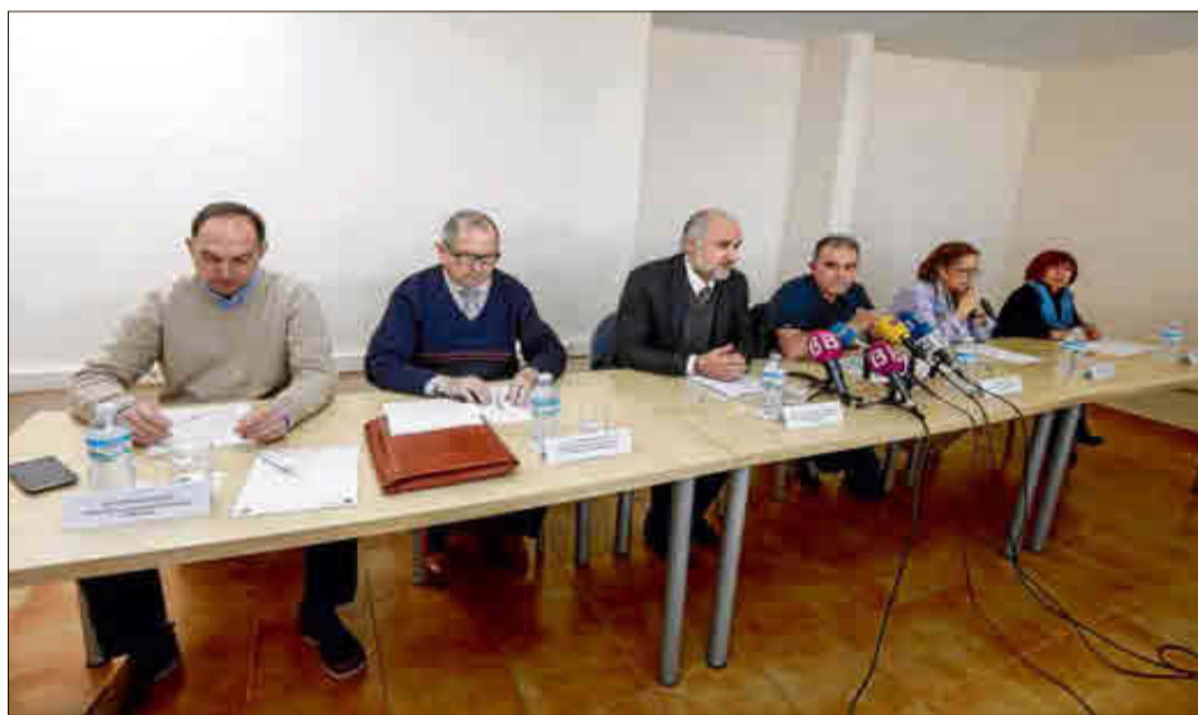
Representantes de las entidades vecinales escuchan al portavoz de los hoteleros de la zona. M. MIELNIEZUK

En este sentido, Barceló afirmó que el consistorio se comprometió a aprobar antes del inicio de temporada una modificación de la ordenanza de convivencia en los espacios públicos y lamentó que, a día de hoy, no es así. “Están perjudicando a la industria hotelera y a los vecinos. Ya teníamos que haber erradicado el turismo de borrachera”, tal como resaltó