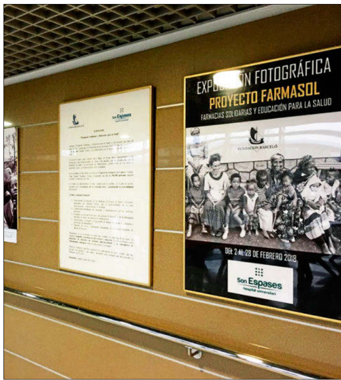
EXPOSICIÓN FOTOGRAFICA SOBRE FARMASOL. El Hospital de Son Espases acoge estos días la exposición fotográfica 'Proyecto Farmasol. Farmacias solidarias, educación para la salud', de la Fundación Barceló. Se trata de una muestra itinerante que consta de más de 20 fotografías de gran formato y en blanco y negro.

Y parece que la charla surtió efecto, ya que los efectivos de refuerzo de la Policía Nacional y la Guardia Civil para el verano pasado en Baleares se incrementaron en un 36,7% respecto a 2016 y permanecieron en las Islas del 1 de julio al 30 de septiembre. Sobre todo en zonas de gran afluencia turística como Calvià o la Playa de Palma.