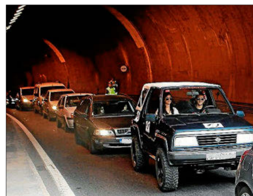
Coches saliendo del túnel de Sóller. J. SERRA

La media de vehículos que han pasado por el túnel de Sóller durante el mes de enero es de 7.995 al día, un 5,5% más que durante el mes de diciembre. Son las cifras habituales de la temporada baja,