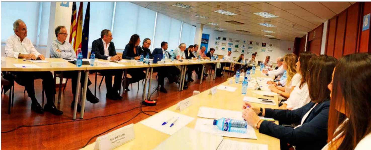
Imagen de la asamblea de la Federación Hotelera de Mallorca celebrada ayer.