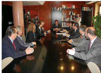
El alcalde recibió ayer a la nueva ejecutiva de la FEHM.