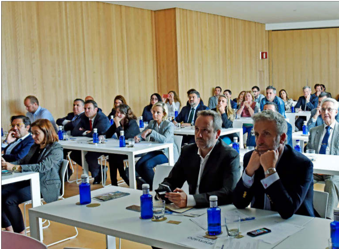
Más de 100 hoteleros acudieron ayer al Meliá Palma Bay a la XII Jornada de Mercados Emisores de la FEHM. ALBERTO VERA